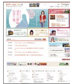
おけいはん.ねっと

また、京阪沿線おでかけ情報サイト「おけいはん.ねっと」( http://www.okeihan.net/ )では、沿線の魅力を分かりやすくご紹介しています。