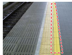
ホーム点字ブロック内方線

当社では、より安心・安全な駅を目指し、平成22年3月末をもって、全88駅・全ホーム208カ所(京都市交通局管理の御陵駅を除く)に設置を完了しています。