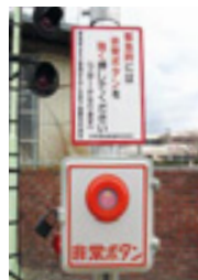
▲踏切支障報知装置

踏切内にて列車を停止させなければいけない事態が生じた場合、非常ボタンを押すことにより運転士に知らせるもので、