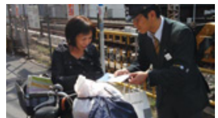
▲踏切での啓発活動

また、沿線の小学校に対しては、踏切事故に対する子どもたちへの教育指導もお願いしています。