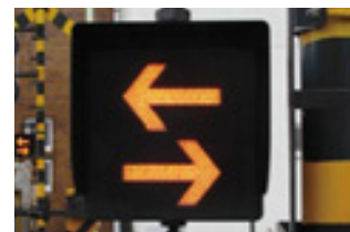
▲列車進行方向指示器

踏切に設置している閃光灯や列車進行方向指示器をLED化することで、従来よりも遠方からの視認性を高めています。