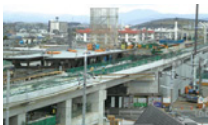
▲淀駅付近高架化工事