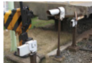
▲踏切障害物検知装置

踏切警報機作動中に踏切内で障害物を検知すると、特殊信号発光機を点滅させて運転士に知らせるとともに、注意喚起の警告ブザーを鳴動させる装置です。現在では、京阪線96カ所、大津線40カ所の踏切に設置しています。