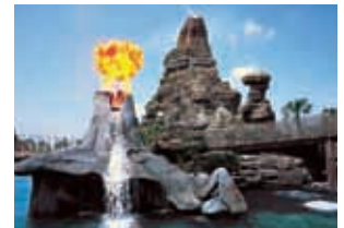
マジカルラグーン

「ひらかたパーク」において遊園地事業を行っています。平成18年度は延べ約107万人のお客さまにお越しいただきました。