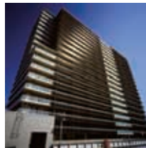
ファインシティくずは

従来、「京阪東ローズタウン」などの大規模住宅地開発を行い戸建住宅を主に販売してきましたが、近年には大規模マンション事業にも注力し、平成18年度は「ファインシティくずは」を販売しました。