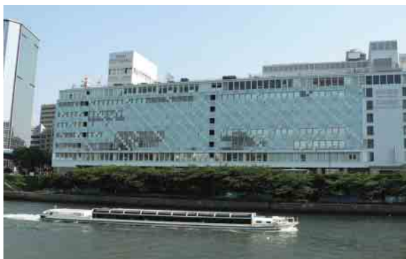
▲京阪シティモール外観

シティモもその歴史の流れをくみ、大川沿いの公園ゾーンと一体化した「水都・大阪」のシンボル施設として、この地に新たなにぎわいを創出しています。