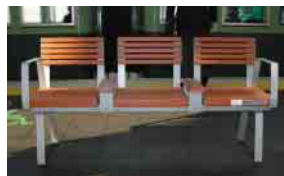
▲ウッディーペット