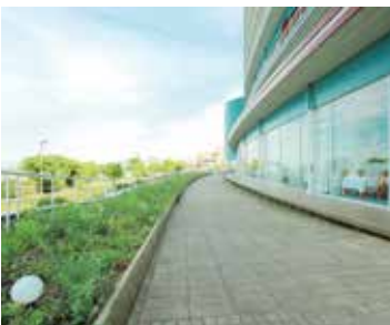
山野草プロジェクト