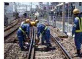
道床突き固め作業

レール、まくらぎ、砕石で構成されるバラスト道床軌道は、日々の列車走行により少しずつ上下左右方向に歪みます。この歪みを保守用車(マルチプルタイタンパー)で正しい位置に復元し、同時にまくらぎ下の砕石を突き固めることによって、乗り心地の改善や騒音・振動の低減を図っています。