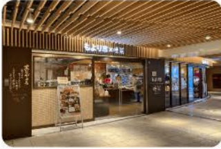
もより市 地下鉄新大阪駅