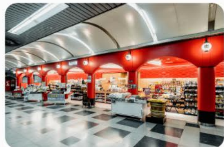
もより市 三条駅のれん街

「もより市」は、“その駅を使っている人が一番欲しいものを置いていく”ことを大切にしています。ですから、各店舗ごとに商品のラインアップも少しずつ違いがあるんです。例えば、ビジネス街の中心的エリアにある「もより市 天満橋駅」なら、お弁当類やオフィスへの土産にも便利のようにスイーツ類を充実させています。一方で、お住まいの方も多く利用される、「もより市 樟葉駅」「ひらかた もより市マーケット」などでは、新鮮な野菜類などを豊富に取りそろえています。「もより市 京橋駅内」では、駅ホーム売店の名物フランクフルトを販売しています。かつて商店といえ、それぞれに個性が異なりました。同じように、その駅ならではの「もより市」らしさをお客さまに楽しんでいただけたらと思います。