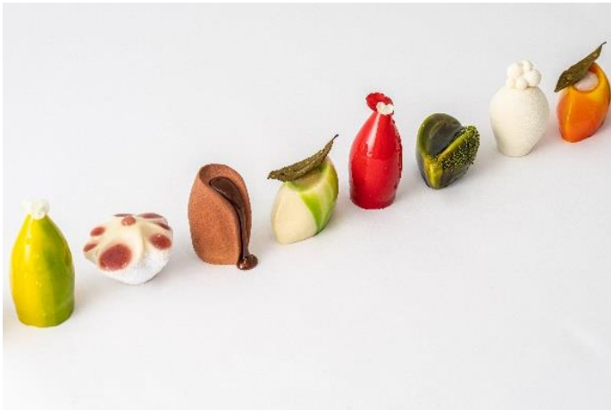
3階のカフェでお召し上がりいただけるデザート