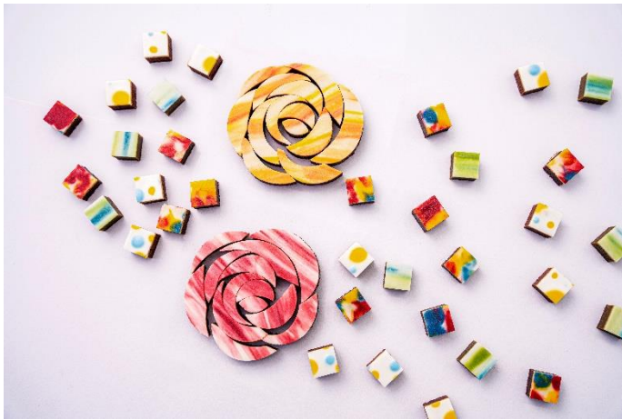
プラントベースのオリジナルチョコレート