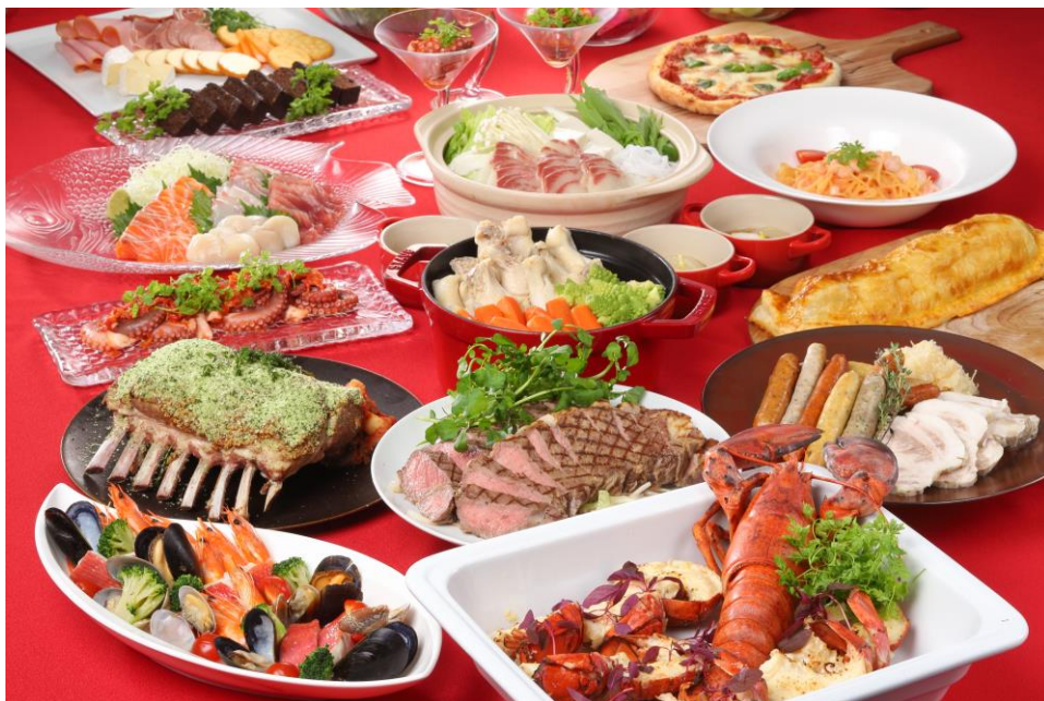
■年末年始特別 ビュッフェ概要

京都の初詣にもアクセスがよい当ホテルで、大切なご家族、ご友人と一年を締めくくり、健やかに新年をお迎えください。