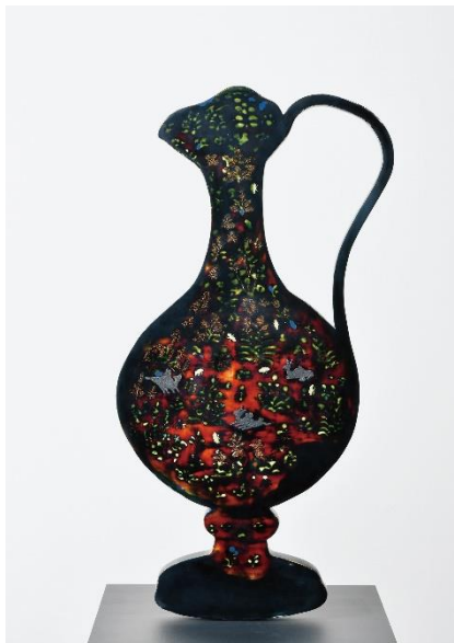
『絵のふりをした壺』