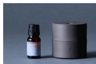
オリジナルアロマオイル 10ml & ファンディフューザー-kō (コウ) セット ¥6,900 (税込)