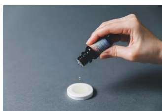
オリジナルアロマオイル 5ml & ストーンセット 2,950 円 (税込)