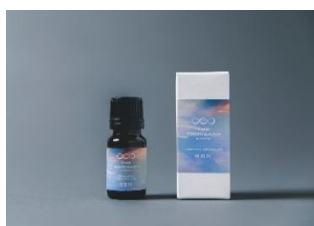
オリジナルアロマオイル 10ml