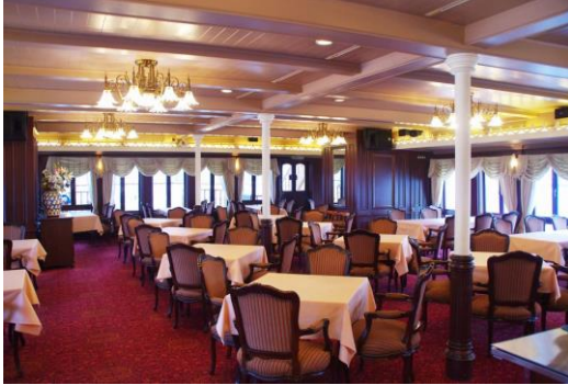
レストラン一例 (会場・座席指定不可)