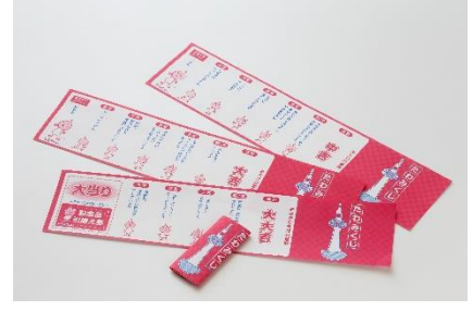
▲たわみくじ(たわわちゃんのおみくじ)