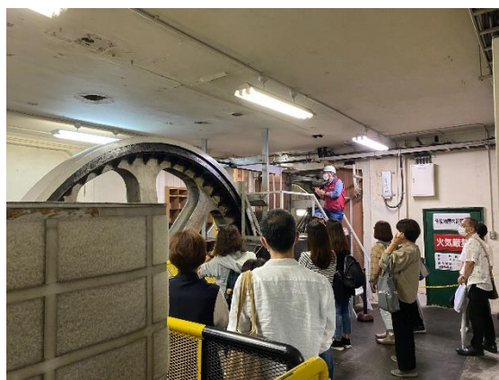
▲坂本ケーブル巻上室バックヤード見学