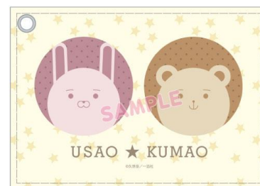
パスケースのイメージ