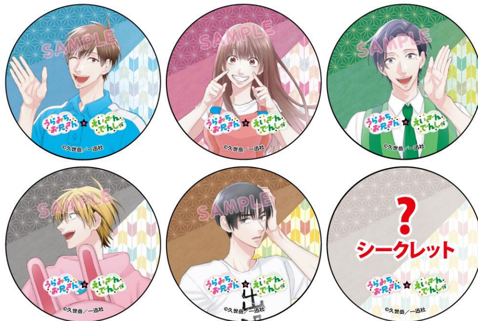
缶バッジのイメージ

※新型コロナウイルスの感染拡大防止策を実施するほか同ウイルス感染拡大状況により、販売開始日時を変更する場合がございます。