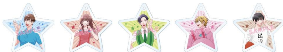
アクリルキーホルダーのイメージ