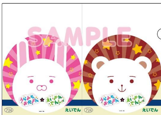
クリアファイルのイメージ