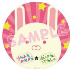
ヘッドマークのイメージ