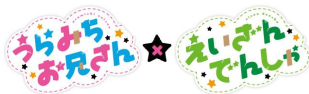
コラボロゴのイメージ

全ての企画には、「うらみちお兄さん×えいざんでんしゃ」のコラボロゴを使用します。