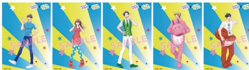
コラボポスターのイメージ