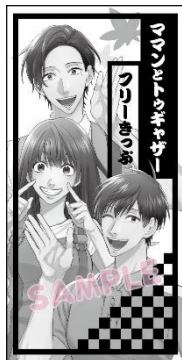
コラボきっぷのイメージ