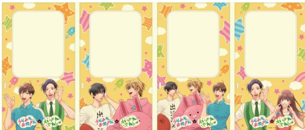
車内ラッピングのイメージ