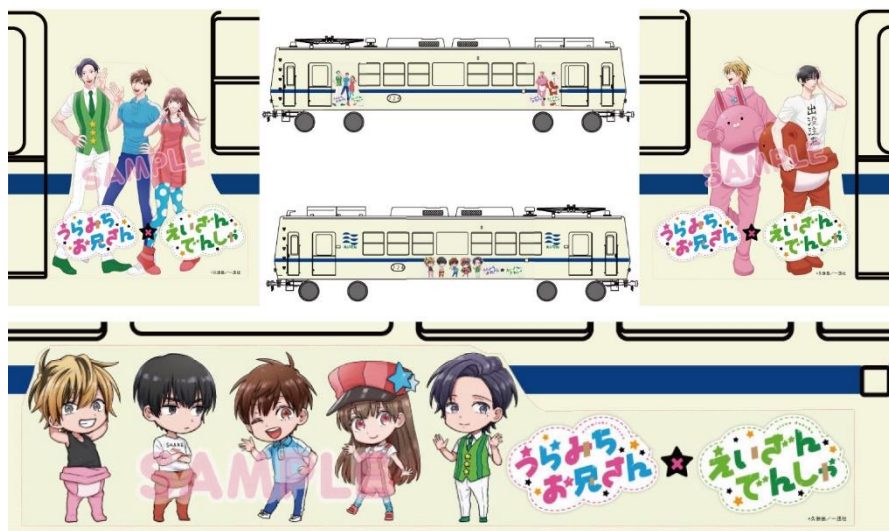
車体ラッピングのイメージ