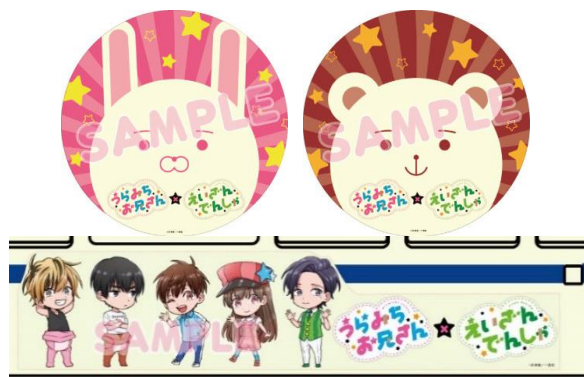
コラボヘッドマーク、ラッピングのイメージ