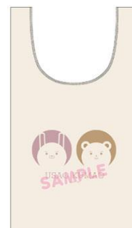
マルシェバッグのイメージ