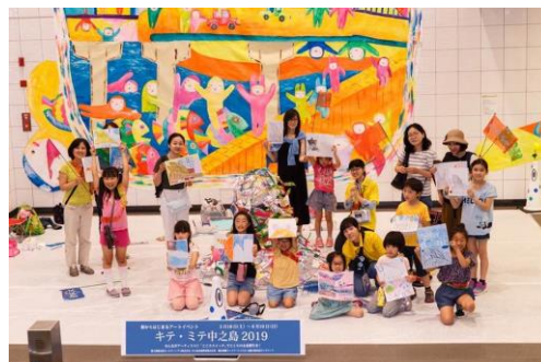
▲昨年の様子(左：大江橋駅特設会場、右：大江橋駅でのワークショップ)