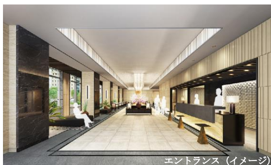
エントランス(イメージ)