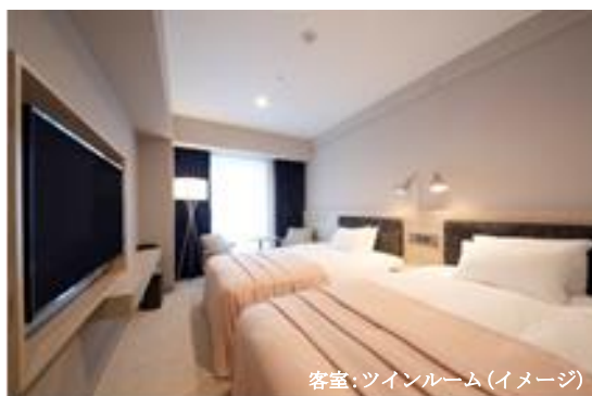
客室:ツインルーム(イメージ)

ホテル周辺は、繁華街「栄・錦エリア」、地下鉄丸の内駅や久屋大通り駅に近く、全国の金融機関をはじめとする企業が集中している、名古屋のビジネス・商業の中心エリアです。名古屋駅や中部国際空港へのアクセスも抜群で、名古屋への訪問が初めての方や、海外旅行者のご利用にも最適です。