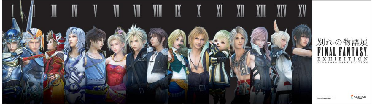
地下通路階段上看板