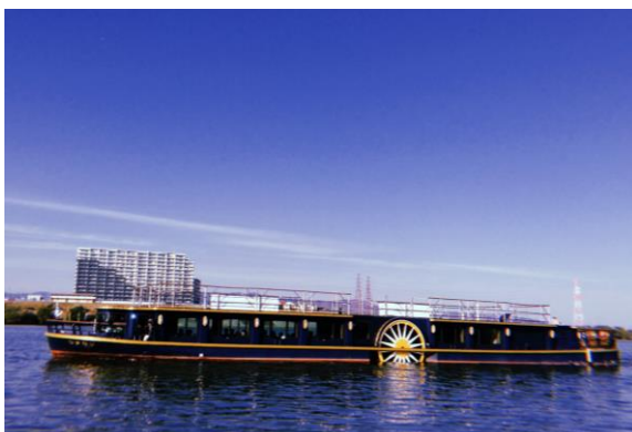
▲淀川浪漫紀行の様子(観光船“ひまわり”)