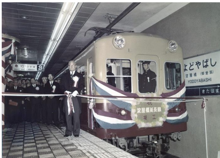
淀屋橋地下延長線竣工当時の様子