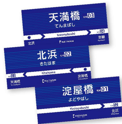
マグネット(イメージ)