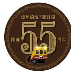
特製ヘッドマーク(イメージ)