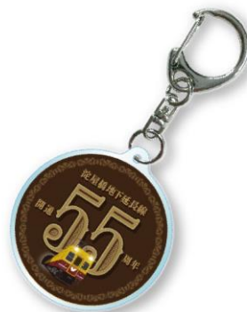
京阪電車オリジナルキーホルダー(イメージ)