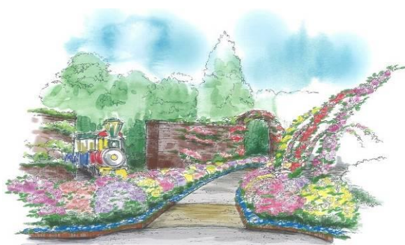
新登場の花壇「時の小道～バラの歩み～」イメージ

また、4月28日(土)からは「ローズフェスティバル」を開催します。昨年大好評だった「ローズガーデン早朝散策デー」が今年も登場。オールドローズが見ごろとなる5月中旬と、ローズガーデン全体が見ごろとなる5月下旬の金・土・日曜に、最もバラが美しい早朝のローズガーデンを散策することができます。さらに、バラの歴史や楽しみ方を熟知したガーデナーによるガイドツアーや、ローズグッズがそろったマルシェなど、イベントが盛りだくさん。華やかなバラとともに、優雅なひとときをお楽しみください。