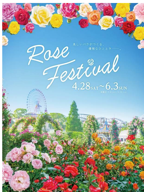
バラのイベント盛りだくさんの「ローズフェスティバル」