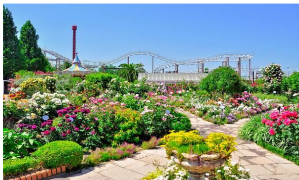
バラの見ごろは5月中旬～6月上旬