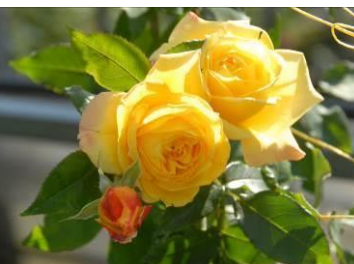
トロピカルシャーベット