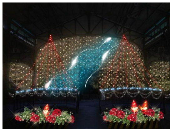
今年は近くを流れる高野川をイメージ