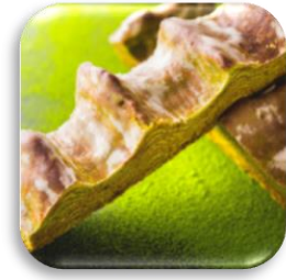
カットバウム（抹茶味）