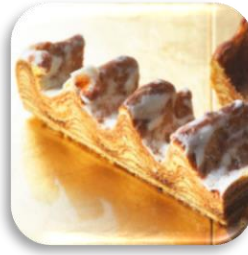
カットバウム（和三盆味）