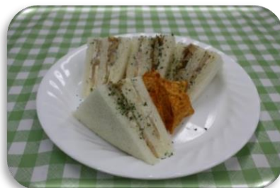
たけのこサンドウィッチ