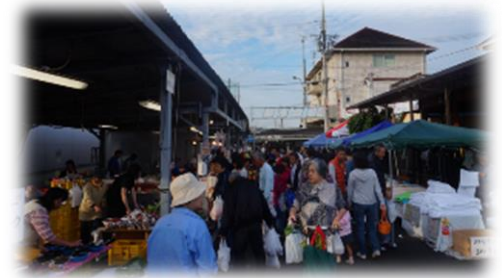
田尻漁港日曜朝市の様子

田尻漁業協同組合では、毎週日曜日の朝（7:00～12:00）に朝市を開催しています。うまいもん祭当日も開催しますので、あわせてお楽しみください。