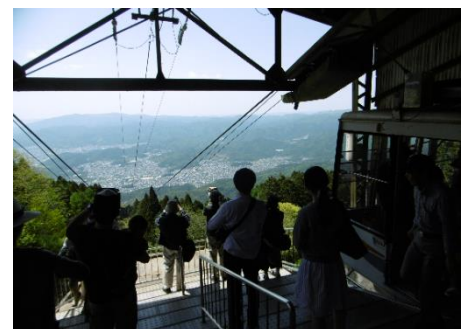
叡山ロープウェイ 比叡山頂駅より京都市街地を望む

※ナイター運行日以外の通常の最終時刻は、 叡山ケーブル 18 時 15 分、叡山ロープウェイ 18 時 05 分