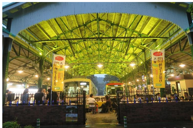
【過去開催時の様子】