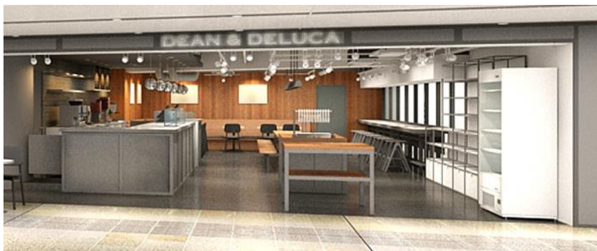
▲『DEAN & DELUCA カフェ 新大阪』(イメージ)