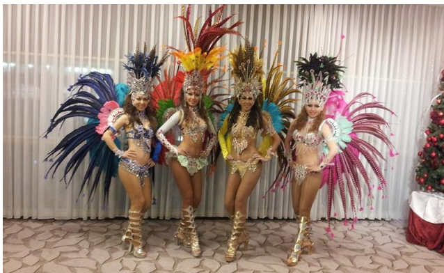
サンパチーム フェジョン・プレット

ダンサー Prime Times (テーマパークダンサー、バレリーナ、ジャズダンサーから結成されたエンターテイメントダンスチーム) と一緒に登場。