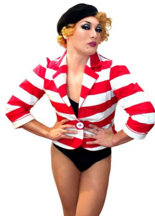
ナジャ・グランディーバ