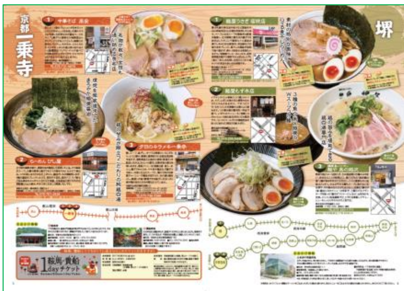
パンフレット3、4ページ（イメージ）