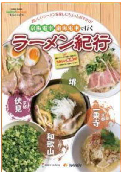
パンフレット表紙（イメージ）

ぜひ、パンフレットを片手に両社沿線へ足をお運びいただき、絶品ラーメンをご堪能ください。詳細は別紙のとおりです。