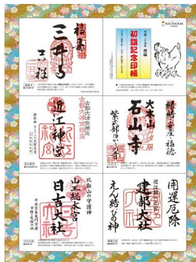
初詣記念印帳(大津線)