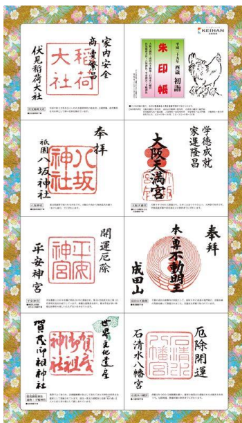
初詣朱印帳(京阪線)