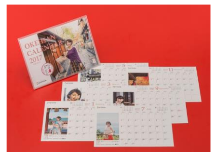
おけいはん卓上カレンダー