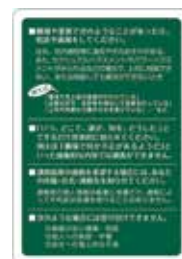
コンプライアンス・ホットラインカード

通報者の個人情報には厳重に保護され、コンプライアンス・ホットライン関与者など限定された者以外に開示されることはなく、通報行為によって不利益な処遇を受けることはありません。